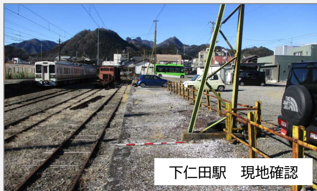
下仁田駅 現地確認