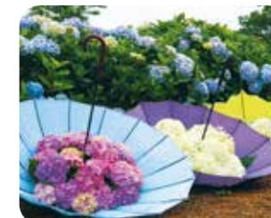
期間限定のフラワーアレンジメント

下仁田あじさい園は、下仁田IC周辺「下仁田町の東の玄関口」に位置し、約3haの敷地に約2万株のあじさいが植栽されている関東でも有数のあじさい園。