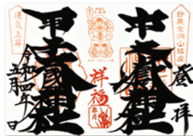
中之嶽神社と大國神社の御朱印

819年に創建した神社。妙義山の麓にそびえ立つ「日本一のだいこく様」は厄除け・開運のご利益が。これまで300年間欠かさず行われているお祭り「甲子祭」と「甲子園」に因み、「野球上達」「必勝祈願」「ケガ除・健康」のお守りや絵馬も。