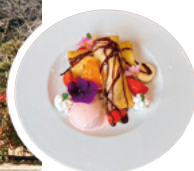
山カフェ妙義 クレープ