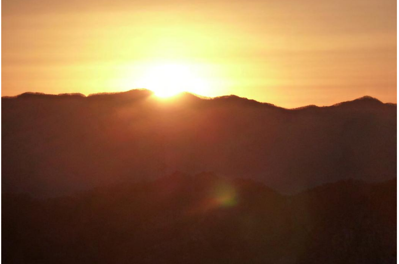
初日の出（荒船山より撮影）