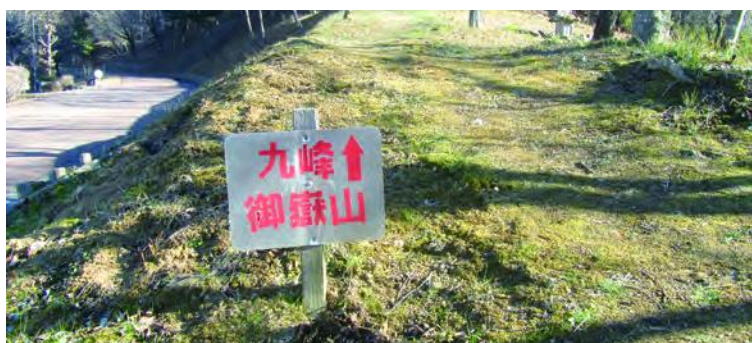
整備された案内板