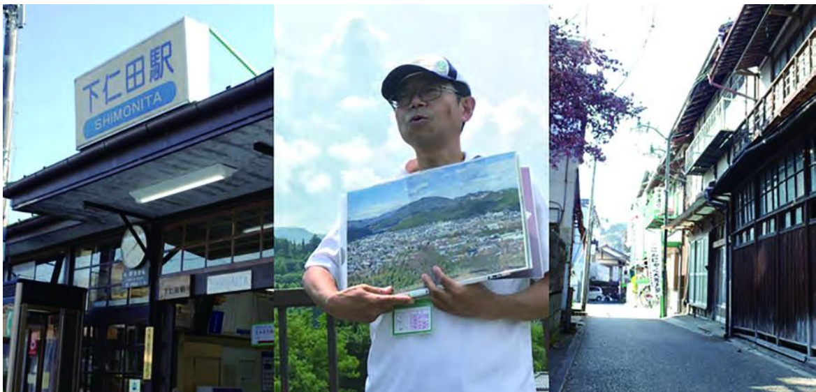
まちなかジオツアー