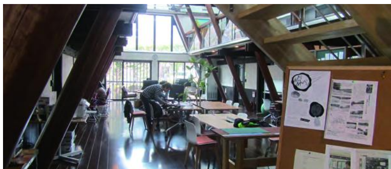
富士見森のオフィス

年は毎年170人程度が減少している。このような人口減少を食い止めるための移住・定住施策として、平成27年12月に「富士見森のオフィス」が開設された。運営については、民間会社へ委託しており、年間1600万円の委託料を支払っている。現在、企業6社、登録会員400名が利用しており、個人利用者の多くは町外の方であり、特に首都圏の利用者が多いとの説明を受けた。見習うべきことは、テレワーク・オ