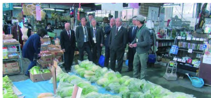
直売市場グリーンファーム

に立った販売方法や出荷する生産者の生産意欲を向上させるための運営方法について研修することができた。 今回の視察研修を通じて、ともに地方の自治体が抱える人口減少と少子化高齢化という課題に対する施策について、当町においても参考となる行政視察でした。