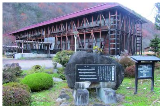
ふるさと体験館きそふくしま

第2日目の伊那市は、長野県南部に位置し、平成18年に伊那市・高遠町・長谷村の3市町村が合併し誕生した。ここでは、「産直市場グリーンファーム」を視察し、直売所来客者の目線