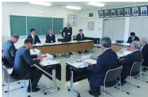
富士見町役場会議室

今回はじめに視察した富士見町は、長野県南東部に位置し、山梨県と接しており東に八ヶ岳、南に南アルプスを望む風光明媚な町。人口は今年10月1日現在、1万4091人だが、近年は人口減少が続く、ここ数