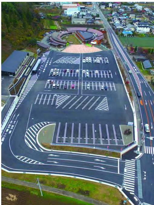
道路改良及び駐車場が整備された「道の駅しもにた」

答 我々議員も皆さんの意見を聞きながら病院の在り方をこれから検討していかなければならないと思います。