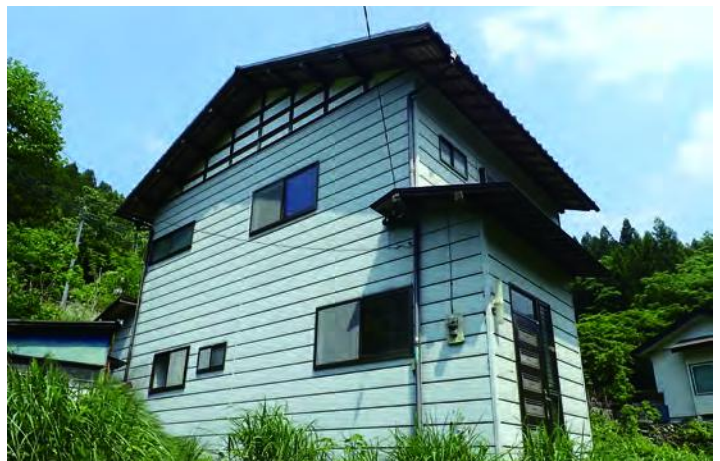
奥栗山溪谷近くの売買物件。自然に囲まれて静かな生活ができます。

議員 財政難は承知していますが、LED化の進捗状況も概ね順調にきており、今後必要な個所への街灯の増設は可能ですか。