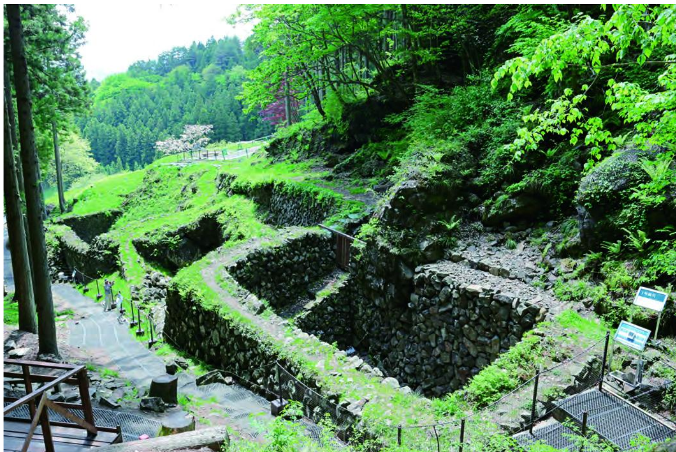
国指定史跡世界遺産の荒船風穴