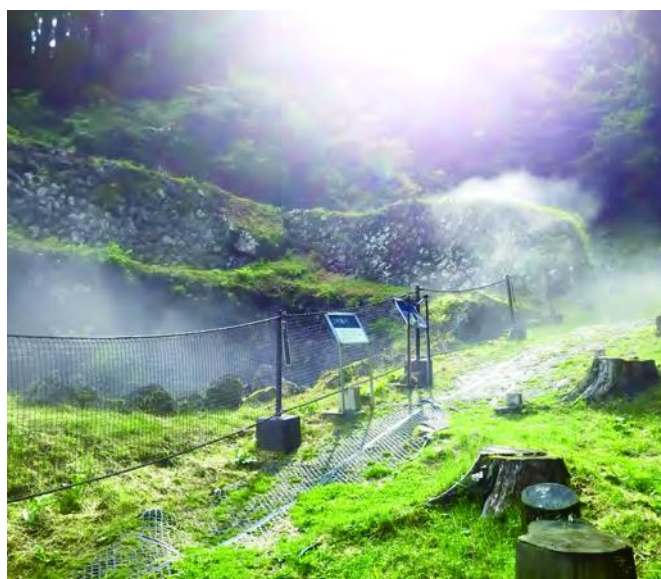
気象状況により冷風が見られます