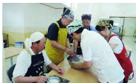
班ごとにこんにやく手作り体験・参加者26人

※CLT(クロス・ラミネイティド・ティンバー・直交修正板)とは：ひき板を繊維方向が直交するように積層接着したパネル。