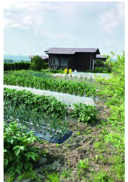
甘楽町ふるさと農園

議員 近年、地震などの影響で防災意識が高まっているなか、アウトドアの雑誌などでも特集され注目されている。今回、初心者向けのブッシュクラフト体験会を町が所有する山やほたる山公園、荒船湖周辺にある農村公園などを利用して実施し、子育て世代を中心に誘客し町の活性化を図ってみては