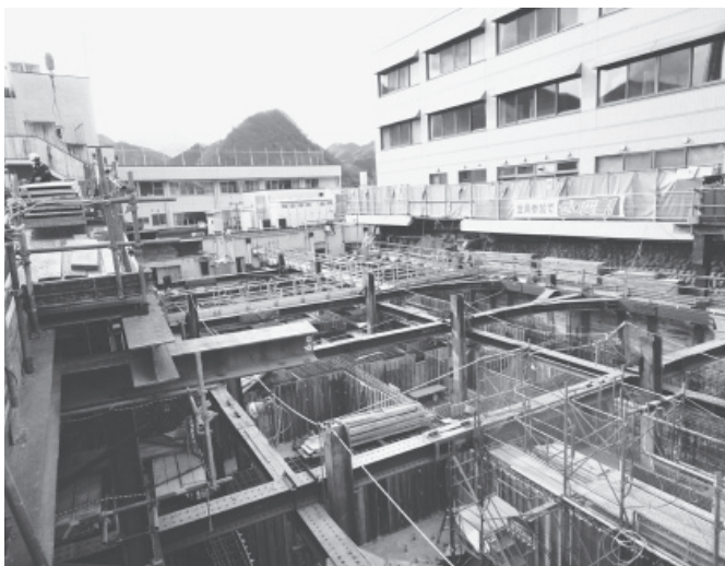
建設が進む新病棟