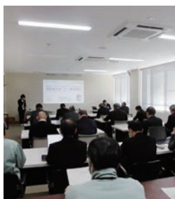
認知症サポーター 養成講座