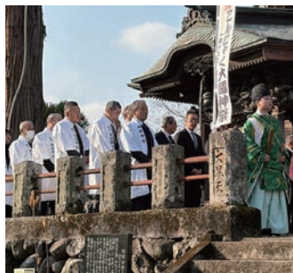
こんにやく大國神祭