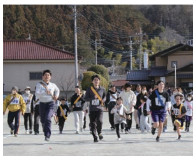
第43回からっ風駅伝大会