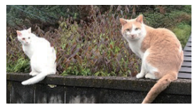
外猫 (飼い主のいない猫)