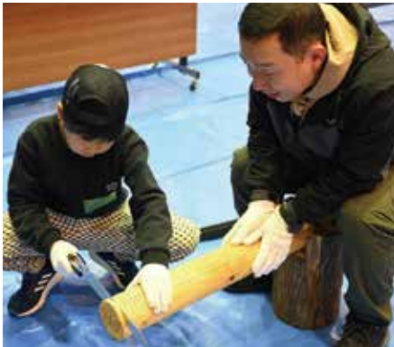
のこぎりを使った丸太切りや輪切りにした木で「ミニオセロゲーム」も体験!