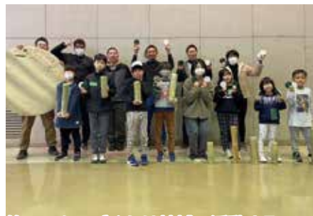
竹ランタンづくりは地域で活動するT・T・T(つどう・つながる・つくりだす下仁田の会)の方を講師に迎え、地域の人との交流もできました。