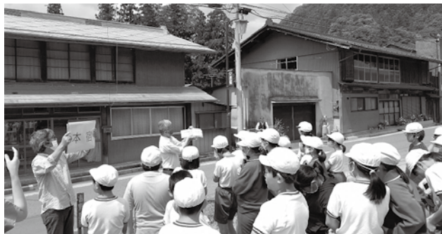
▲本宿でのガイドツアー

夏に西牧や青倉などをガイドとともにバスで巡って地域のことを学び、その成果を絵や模型などの作品にして、1月21日（日）まで自然史館3階で展示しています。子どもたちの力作をぜひ見学にお出かけください。