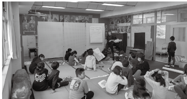
▲自然史館での展示内容検討