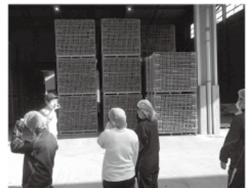
▲荻野商店にて こんにやく産業の学習

各行事に参加される方はマスク着用でご参加ください ※新型コロナウイルス感染状況に応じて中止となる場合があります。