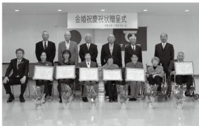
金婚祝慶祝状贈呈式