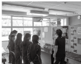
▲自然史館にて 自然の成り立ちの学習

今回の課題研究を通じ、こんにやくの産地としての下仁田町について理解が深まったことと思います。