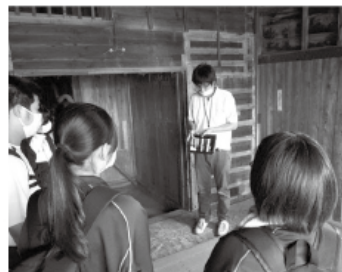
▲田島屋倉庫にて こんにやく精粉の歴史の学習