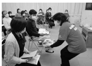
ヘルスメイトの活動の一コマ (働き世代の食育講座)

※新型コロナウイルスの感染状 況によっては講座を中止させて いただく場合もあります。