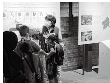
世界遺産センターでは、ガイドのみなさんの話に耳を傾けていました。