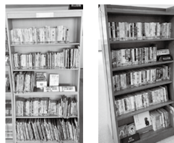
次回の入替 令和5年1月20日

図書室では、4か月に1度県立図書の入れ替えを行っております。すごしやすい秋の季節に図書室でお気に入りの本を見つけて、家や好きな場所でゆっくりと読書をお楽しみください!