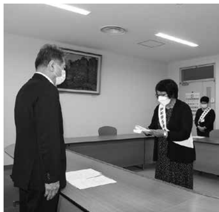
題点を伝えるメッセージ伝達が行われました。

知的障害者福祉月間(9月1日～30日)に合わせ、9月15日に下仁田町役場で福祉パレードのメッセージ伝達が、行われました。本年は、新型コロナウイルス感染症拡大防止のためパレードは行わず、「甘楽郡手をつなぐ育成会」会長から町長、議長、教育長あてに、知的障害者を取り巻く現状や問題点を伝えるメッセージ伝達が行われました。