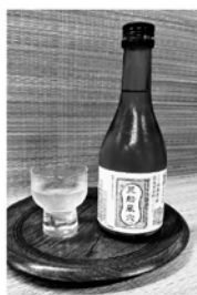
特別純米酒「荒船風穴」(300ml) (税込 480円)

地元酒蔵・聖徳銘醸と共同開発した地酒です。荒船風穴で冷蔵貯蔵する際に利用した種紙をラッピングした冷酒です。4合瓶サイズ(税込1,380円)も販売しています。