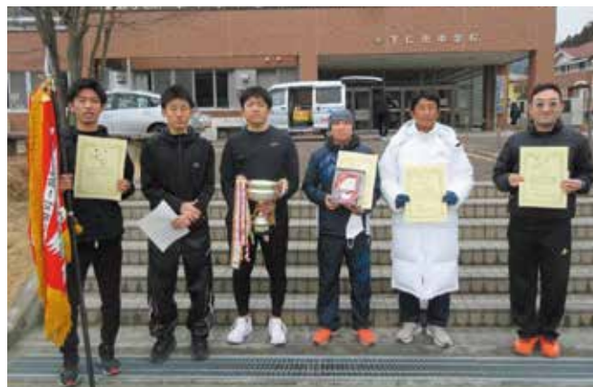
▲2部優勝 しのめ信用金庫