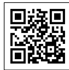
下仁田町 テレワークオフィス