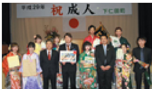
▲抽選会で当選された方々