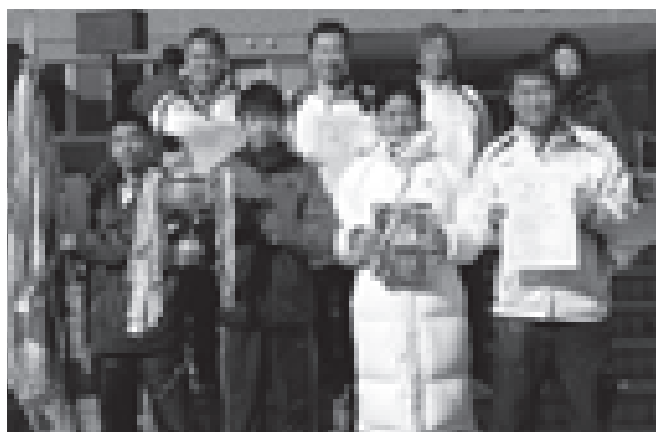
▲2部優勝 しのめ信用金庫