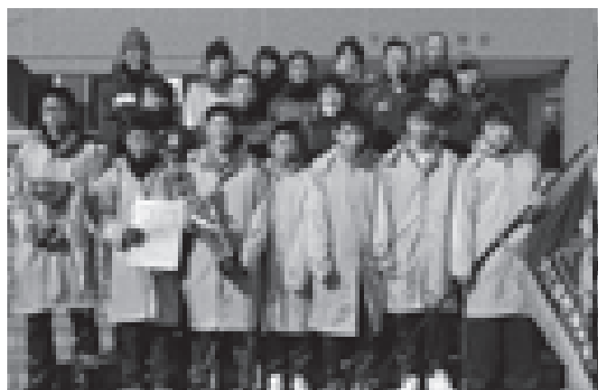
▲1部優勝 下仁田支部

●1部とは…下仁田町5支部 ●2部とは…クラブチーム及び職場チーム ●3部とは…オープン参加