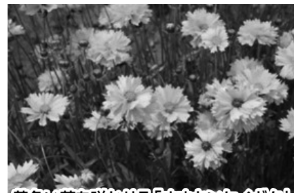
黄色い花を咲かせる「オオキンケイギク」