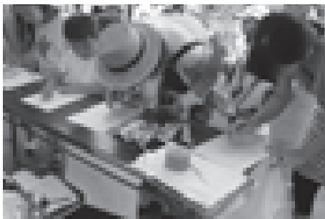
にぎわう青少推ブース

また、夏祭り会場周辺では「街頭パトロール」を実施しました。このパトロールは、青少推・学校・PTA・防犯協会・保護司・更生保護女性会・民生児童委員などの集まりである「健全育成会」が主催となり、町全体への非行防止の意識付けを目的とし実施するものです。雨の降るなか各団体から53名が参加しパトロールを実施しました。