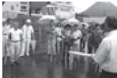
パトロール出発前の町長あいさつ