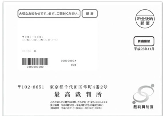
▲名簿記載通知の発送用封筒(H25年11月送付分)

なお、この段階では、まだ具体的な事件の裁判員候補者に選ばれたわけではありませんので、すぐに裁判所にお越しいただく必要はありません(実際に裁判所にお越しいただくことになった場合には、別途お知らせします。)