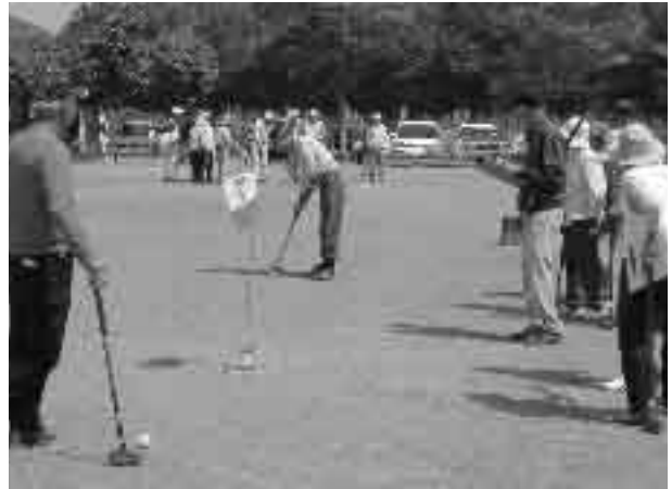
▲【7番ホール】 白熱したチーム対抗の団体戦

※あなたもクラブの仲間に入りませんか。 詳しくは事務局までお気軽にお問合せ下さい。 (連絡先:健康課高齢者支援係 ☎82-2111 内線328)