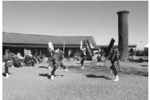
▲ダイナミックな踊りの「おきなわエイサー」

また、道の駅内の広場にて「だんべえ踊り」・「おきなわエイサー」の上演やミニライブが開催され、来場された方々は大いに楽しんでいました。