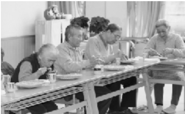
▲そばをご馳走になる通所者の皆さん