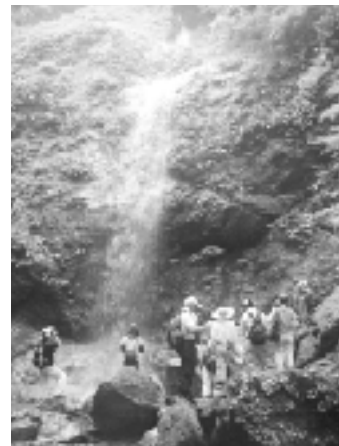
▲蒔田不動の滝 観察会