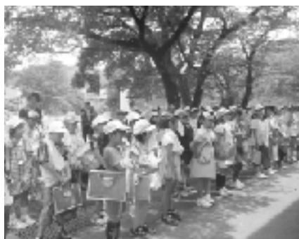
▲下仁田小学校授業の様子