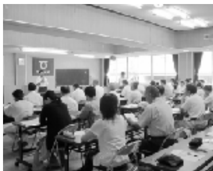
▲下仁田中学校3年生総合学習発表会の様子