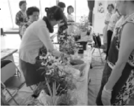
▲寄せ植え教室を開催しました。