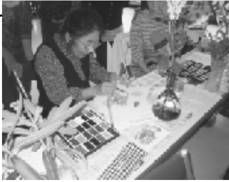
▲水彩画教室を開催しました。