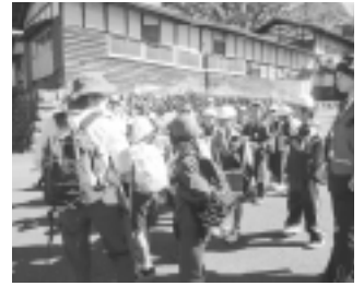
▲黒岩小学校川原の石観察会

10月19日(金) 富岡市の黒岩小学校の1・2年生が青岩公園で川原の石の観察を行い、様々な石の名前や形について学習しました。