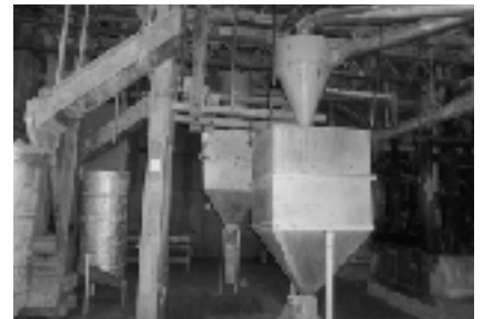
▲田島屋こんにゃく精粉工場

10月25日(木) 埼玉県加須市から開智未来中学校2年生が、青岩公園で石の標本作りのための石集めを行いました。昼食後、3班に分かれて自然史館展示室・跡倉クリッペのすべり面・フェンスターを見学しました。