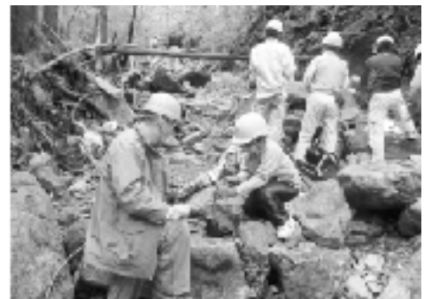
▲下仁田化石探検隊