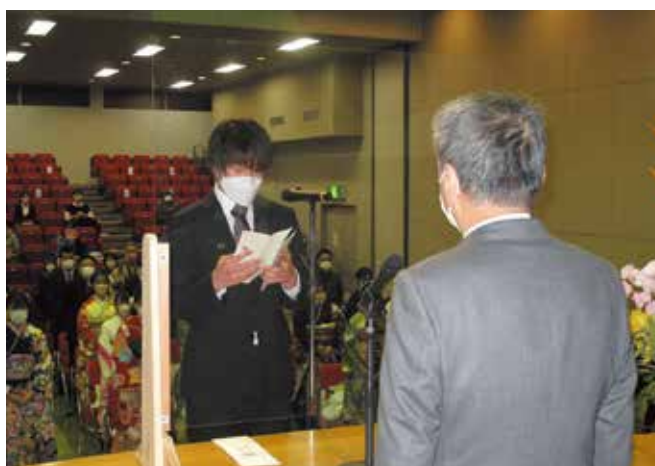
▲参加者代表の謝辞