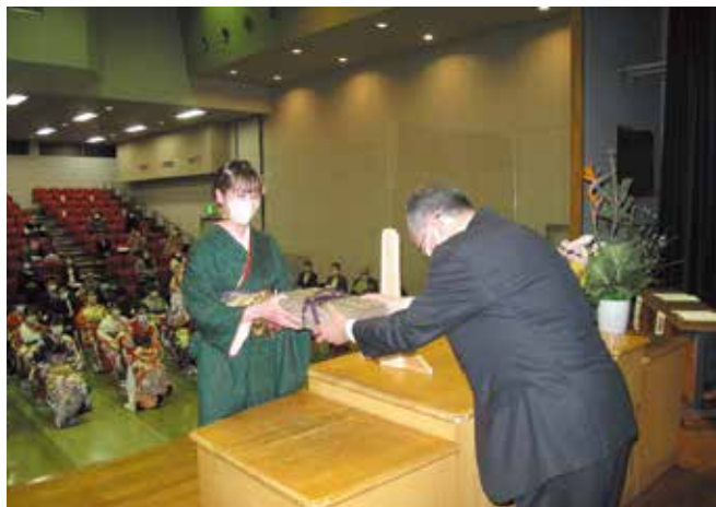
▲20歳の自分への手紙贈呈式