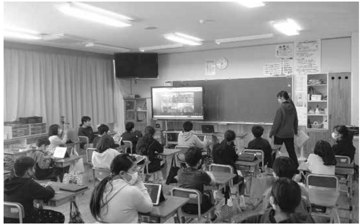
▲オンライン交流会の様子

● 下仁田町自然史館 ● 開館時間 午前9時から午後4時半 ● 休館日 毎週水曜日 ● 問い合わせ ☎70-3070