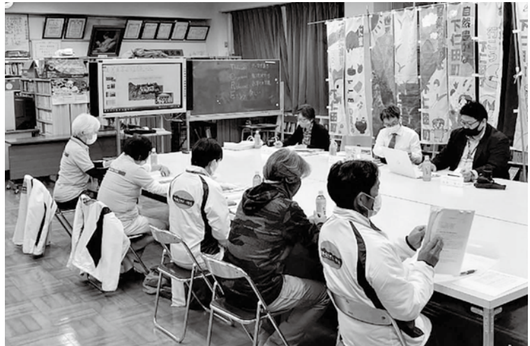
現地調査 住民活動報告会

調査員との意見交換の中で気づいた新たな課題を解決しながら、より一層ジオパークを活かしたまちづくりを進めていきますので、今後ともよろしくお願い致します。