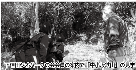
下仁田ジオパークの会会員の案内で「中小坂鉄山」の見学

下仁田高校3年生(アドバンスコース)の生徒は、令和3年度『鉄で栄えた町「下仁田ジオパーク」を探る』をテーマに「中小坂鉄山」の見学や、川原で採取した砂鉄からの鉄を作る実験とうを行いました。