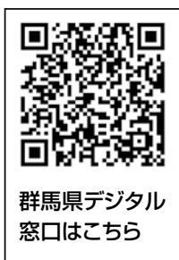
群馬県デジタル窓口はこちら