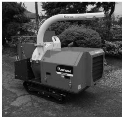
自走式〈大型〉樹木粉碎機