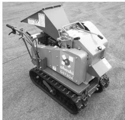
自走式〈小型〉樹木粉碎機