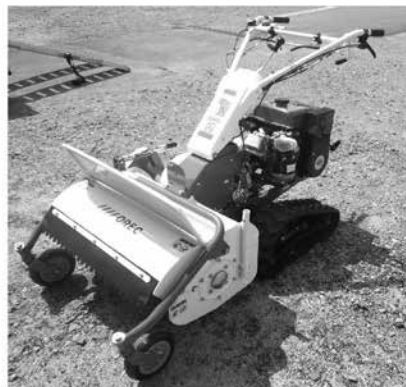
自走式草刈粉碎機